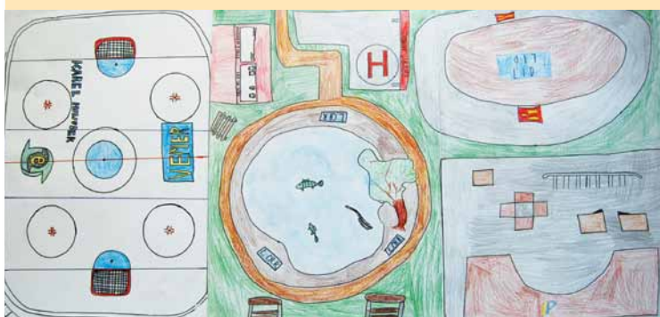
2. místo – kolektiv ze ZŠ Lomnice u Sokolova

Začátkem září letošního roku Úřad Regionální rady regionu soudržnosti Severozápad vyhlásil dětskou výtvarnou soutěž na téma „U nás bychom potřebovali“ určenou pro základní školy regionu Severozápad, tedy celého Ústeckého i Karlovarského kraje.