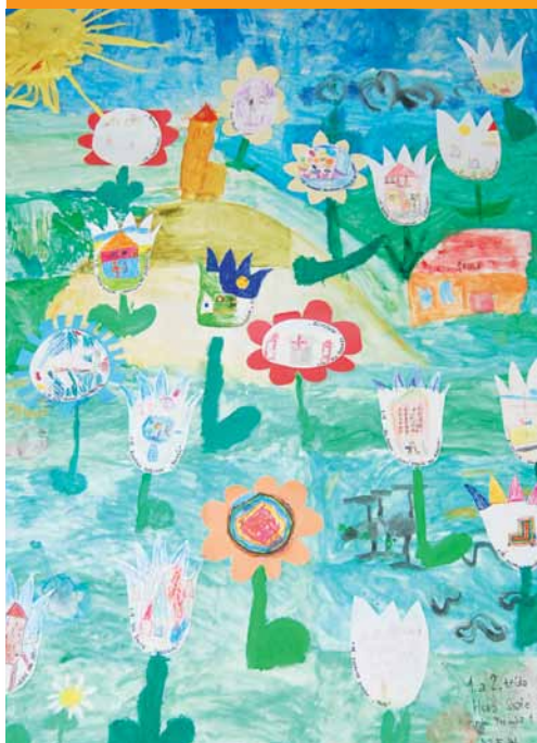
1. místo – kolektiv ze ZŠ Hora Sv. Kateřiny

Soutěž byla ukončena po dvou měsících trvání k 31. říjnu 2011 s velmi příznivými výsledky. Do soutěže bylo zasláno celkem 175 výkresů z 33 základních škol. Soutěžilo se jak v kategorii jednotlivců, tak v kategorii kolektivů. V pátek 4. listopadu 2011 zasedla pětičlenná odborná hodnotící porota, tvořená zaměstnanci Úřadu Regionální rady a rozhodla o výsledcích celé soutěže. Porota hodnotila nejen výtvarné nadání dětí, ale i originalitu nápadu. Do soutěže byla zaslána opravdu spousta krásných a nápaditých výkresů, výběr těch nejlepších byl složitý, porota však nakonec vybrala z obou kategorií ty nejpodařenější.